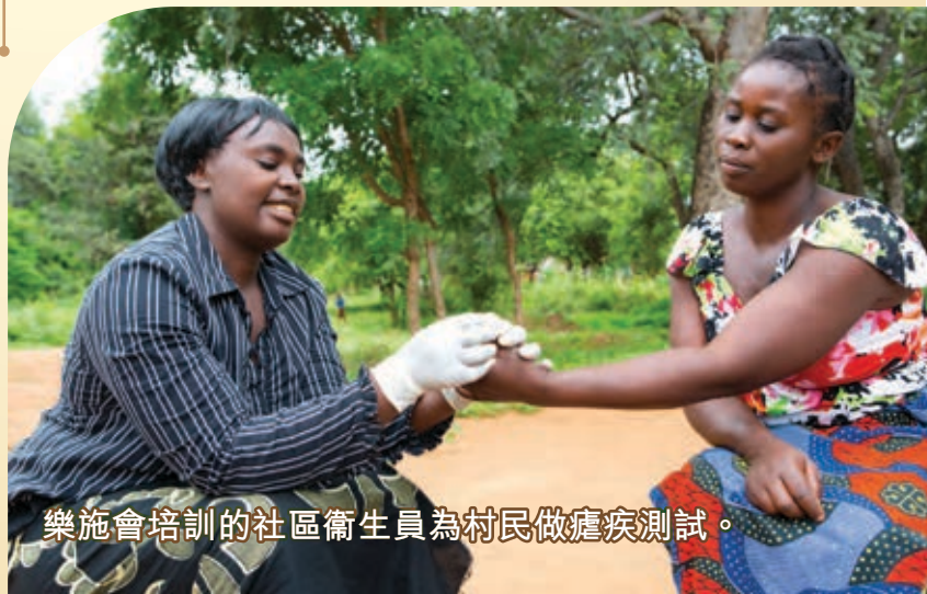
樂施會培訓的社區衛生員為村民做瘧疾測試。