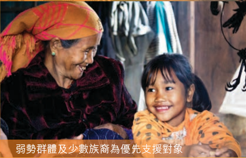
弱勢群體及少數族裔為優先支援對象