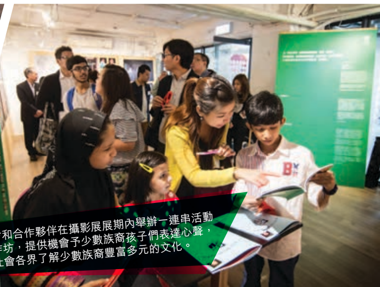
樂施會和合作夥伴在攝影展展期內舉辦一連串活動和工作坊，提供機會予少數族裔孩子們表達心聲，並讓社會各界了解少數族裔豐富多元的文化。