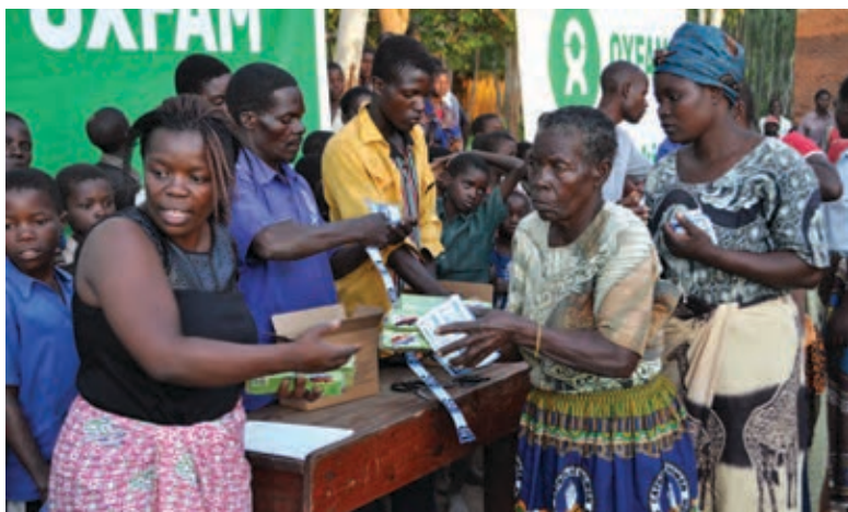
樂施會迅速向馬拉維災民提供現金援助、安全飲用水、衛生用品及設施。