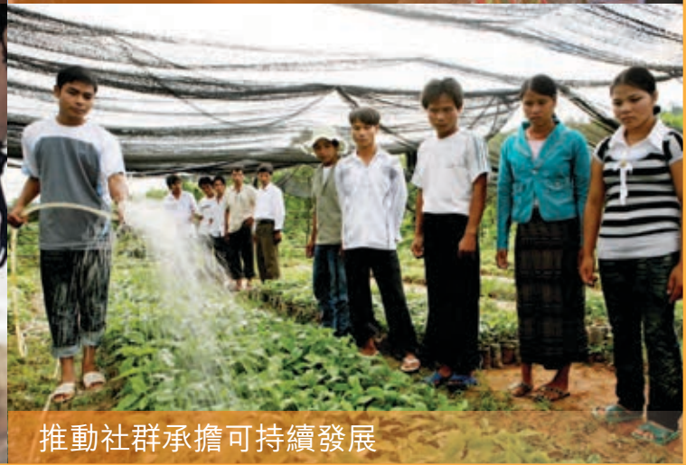
推動社群承擔可持續發展