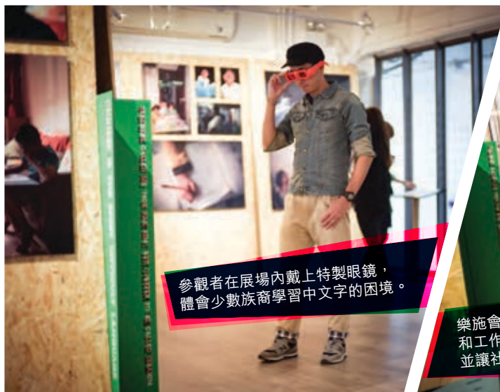
參觀者在展場內戴上特製眼鏡，體會少數族裔學習中文字的困境。

協助本港少數族裔學習中文，增加他們在社會上游流動的機會，脫離貧窮，這非常重要的一步，需要你支持。請即加入網上聯署： http://doyoureadme.oxfam.org.hk/?page_id=61 ，呼籲政府作出行動！