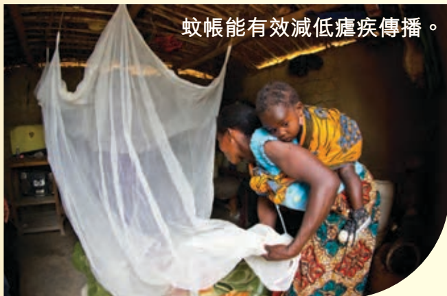
蚊帳能有效減低瘧疾傳播。

根據世界衛生組織資料，二零一三年，全球約有60萬人死於瘧疾，其中43萬是兒童。全球九成瘧疾病例，集中在撒哈拉以南的非洲地區。