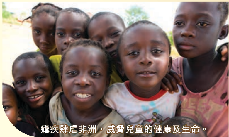
瘧疾肆虐非洲，威脅兒童的健康及生命。