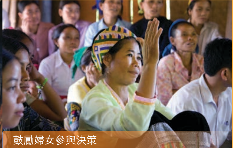
鼓勵婦女參與決策