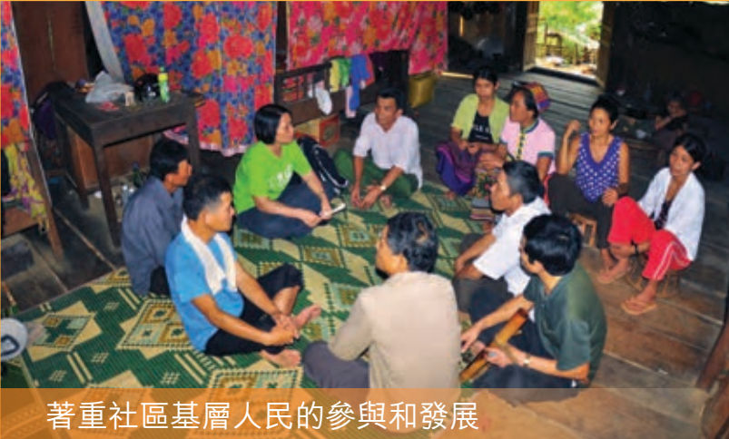
著重社區基層人民的參與和發展